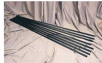
F12001V Verniciato Nero (a spruzzo)