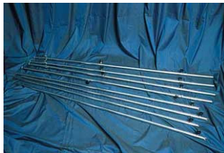
F012001C Cromato (in bagno galvanico)