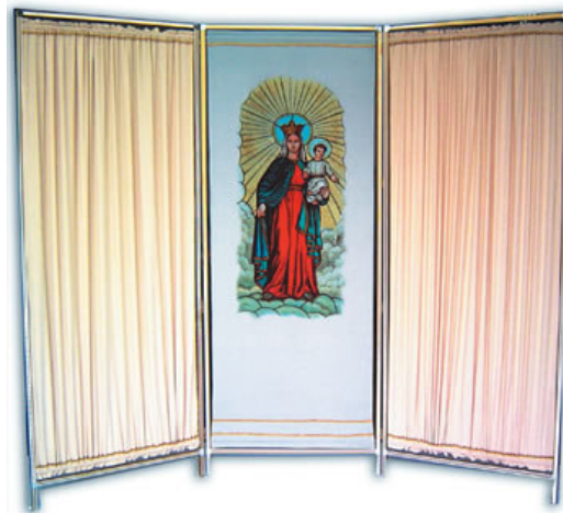
ESEMPIO DI STAMPA DIGITALE

Paraventi a 3 – 4 – 5 – 6 – 7 ante incernierate o componibili, in velluto o tessuto (a richiesta ignifugo C1 e/o idrorepellente), semplici o double-face, con struttura in alluminio. Per completare il paravento forniamo icone e quadri, con immagini religiose e paesaggistiche, da appendere. Inoltre forniamo immagini religiose e paesaggistiche direttamente sul tessuto.